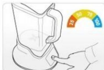
5) Slå på strömmen, vänta i 10 minuter tills den är avstängd.