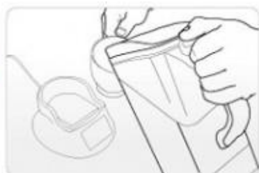
6) Drink det beredda alkaliska reducerade vattnet.