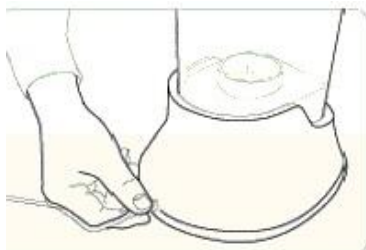
1) Anslut strömkabeln

5) pH-jämförelse mellan behandlat och obehandlat vatten: Häll lite av det behandlade vattnet i ett glas och lite obehandlat vatten i ett annat glas. Släpp en eller två droppar av red phenol från det medlevererade testsetet i respektive glas. Jämför det med färgdiagrammet från testsetet.