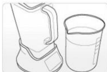
4) Häll i 1,8 liter dricksvatten i behållaren.