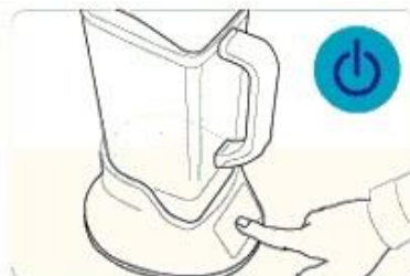
3) Slå på strömmen. Vänta tills att den slås av. Rengör filtret och behållaren med rent vatten två eller tre gånger.